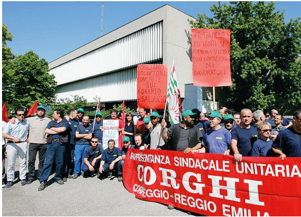
Una manifestazione dei dipendenti davanti allo stabilimento della Corghi di Correggio

Tra i dipendenti, intanto, regna la perplessità: c'è chi non si capacita del fatto che si parli di esuberi nonostante il fatturato stia ritornando quello dei tempi prima della crisi. E si parla di un calo di personale che verrà programmato sulla base di una diminuzione della produzione nel corso del prossimo anno. Se non ci saranno ulteriori sviluppi in settimana, lunedì si terrà un'ulteriore assem-