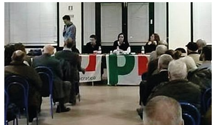
L'assemblea promossa dal Pd sul futuro dei rifiuti e della discarica

Dal pubblico ci sono state domande sulla chiusura della discarica di via Levata, già prevista entro il dicembre 2015. Poiché l'ultima fossa non è ancora del tutto esaurita, si possono considerare due scenari: se tutti i rifiuti della provincia vengo smaltiti nell'impianto di via Levata, questa andrà ad