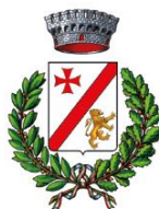
Comune di Boretto