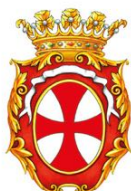
Comune di Reggiolo

Centro di riuso di Reggiolo Via Respighi (a fianco dell'isola ecologica) ORARI DI APERTURA Martedì 9:00-12:00 Giovedì 9:00-12:00 Sabato 9:00-12:00 e 15:00-18:00